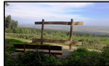
Nr. 8 Durchblick ins Calenberger-Land bei Müllers-Höh