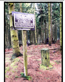
Nr. 14 Gauß-Stein Deister I